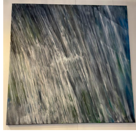
Fulufjället 2021 117x117 cm akryl på duk 38.000:-