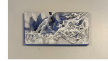
Långt ute / Far away 2020 20x40 cm akryl på duk 8.500:-