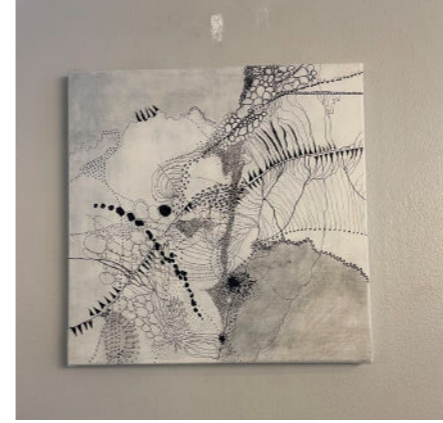
Paris Palustre 2006 36x36 cm tusch och blyerts på duk 12.500:-