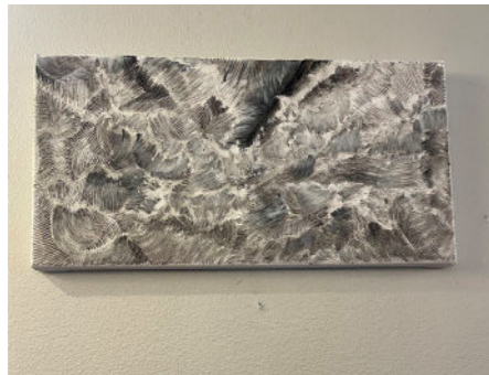
The Sea is White 2023 20x40 cm akryl på duk 8.500:-