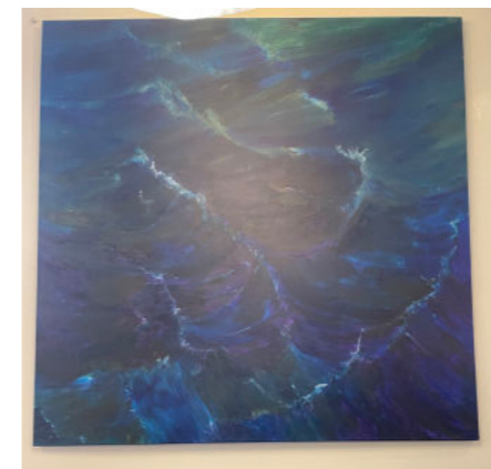
The Ship 2023 140x140 cm akryl på duk 45.000:-