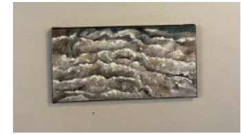
Långt hemifrån (Långtansfull kaffedrickare) juni 2020 20x 40 cm akryl på duk 8.500:-