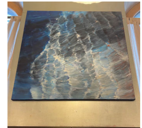
High Sea / Det stormar 2022 112x112 cm akryl på duk 38.000:-