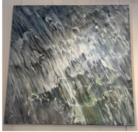
Njupeskår 2021 117x117 cm akryl på duk 38.000:-