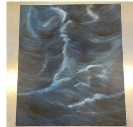
Mare Animae 1997 150x130 cm olja på duk 45.000:-