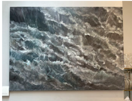
Inside 2012 120x 90 cm akryl på duk 34.000:-