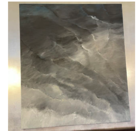
The Moment 2001 150x130 cm olja på duk 45.000:-