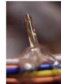
FEARLESS AND FABULOUS , SEK 3 000. Upplaga: 20.