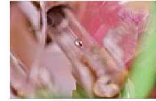
EAGER, SEK 3 000. Upplaga: 20.