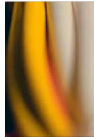
TENDER, SEK 3 000. Upplaga: 20.