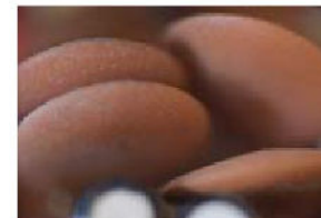
CREMA, SEK 3 000. Upplaga: 20.