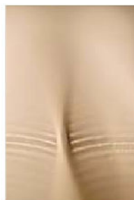
BASE, SEK 3 000. Upplaga: 20.