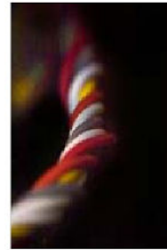
TRANSMISSION, SEK 3 000. Upplaga: 20.