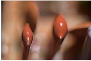
TWICE THE FUN, SEK 3 000. Upplaga: 20.