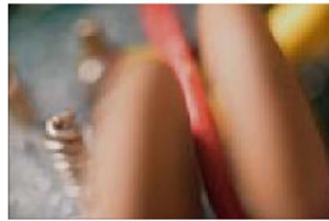
FORGET ME NOT, SEK 3 000. Upplaga: 20.